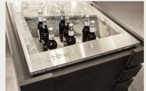
Kühleinheit für Getränke.