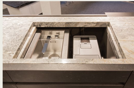
Geöffneter Schacht für Spüle/Kaffeemaschine.